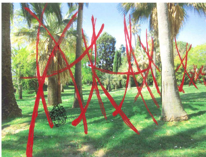
Calligraphie dans l'espace Environ 5 m de haut Installation sans fixation au sol mais soutenue par des filets remplis de livres suspendus à différents points de l'installation