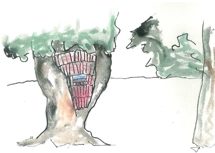
Installation de livres dans le creux d'un arbre avec une fenêtre sur le monde